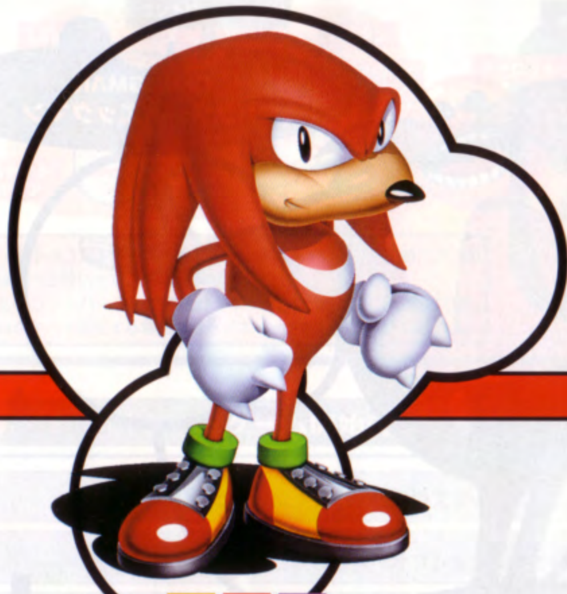
KNUCKLES THE ECHIDNA ナックルズ・ザ・エキドゥナ