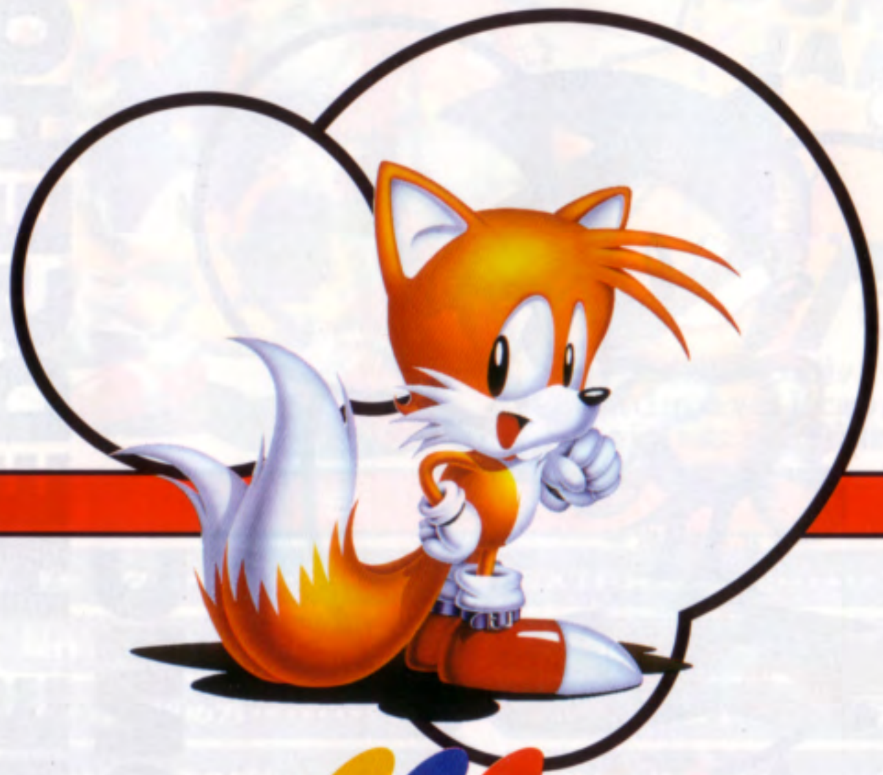
MILES "TAILS" PROWER マイルス "テイルス" パウアー