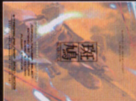
VERTICAL 1/VERTICAL 2