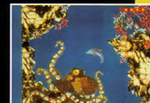
ECCO - GAME GEAR

Plonge dans un univers de toute beauté : les profondeurs des océans, où un voyage magique vers l'inconnu t'attend. Ecco, un jeune dauphin va devoir découvrir pour quelle raison un mystérieux cataclysme s'est abattu sur les océans. 17 niveaux sont à explorer : en partant des eaux limpides des lagons, Ecco va visiter des cavernes souterraines, la banquise du Grand Nord, la cité d'Atlantis et il retournera même dans la préhistoire. Ce voyage dans le monde aquatique est vraiment un régal !!